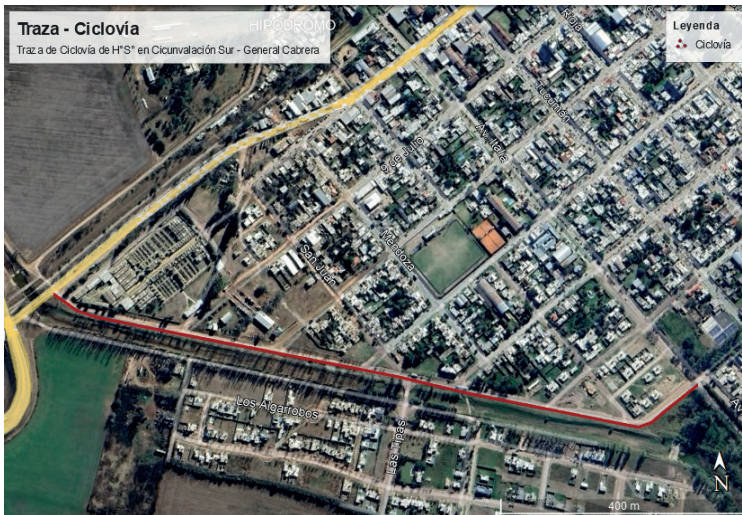
CICLOVIA DE HORMIGÓN EN CIRCUNVALACIÓN SUR PET - Página 2 de 16